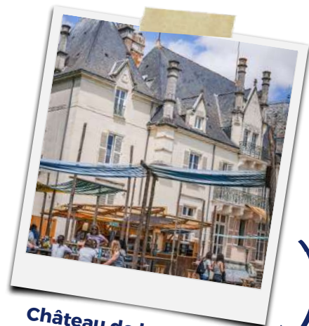
Château de la Frémoire Nouvelle ambassade des vins de Nantes. Ouverture en juillet 2024

Vous permettent d'avoir accès à de nombreux avantages, une visibilité forte sur des événements, des sites ou des supports souvent inaccessibles seul.