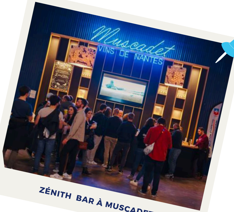
ZÉNITH BAR À MUSCADET