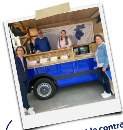
Vos vins prennent le contrôle du Muscadruck ! Serbotel, Heures d'été, Rendez-vous de l'Erdre, Grand Marché des Pays de la Loire...

Le rôle d'ambassadeur, vous permettra d'accéder à toutes ces opportunités dans le cadre de la promotion des vins AOC de Nantes.