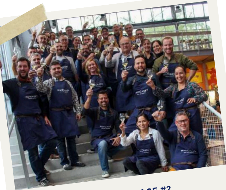
NOUVEL ANCRAGE #2