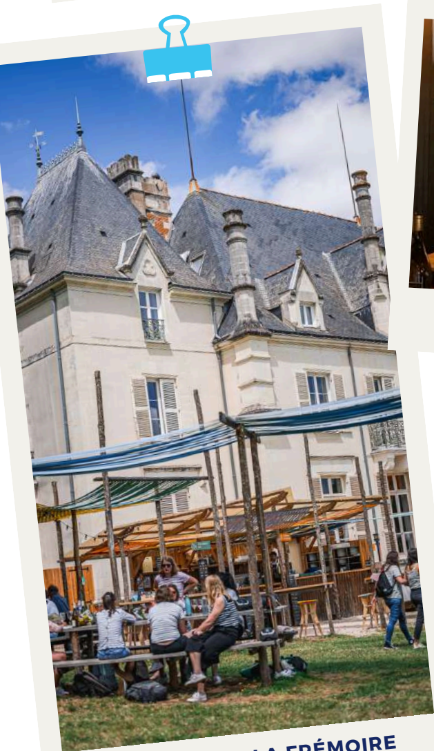
CHÂTEAU DE LA FRÉMOIRE VOYAGE EN MUSCADET