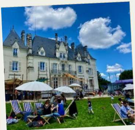
EXPÉRIENCE HOMARD À LA FRÉMOIRE