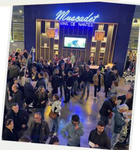
EXPÉRIENCE ZÉNITH NOUVEAU BAR À MUSCADET