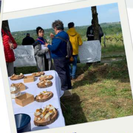
EXPÉRIENCE VAL DE LOIRE MILLÉSIME