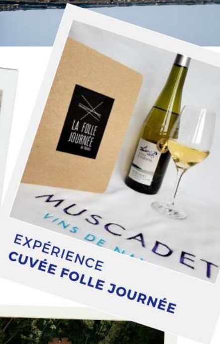
EXPÉRIENCE CUVÉE FOLLE JOURNÉE