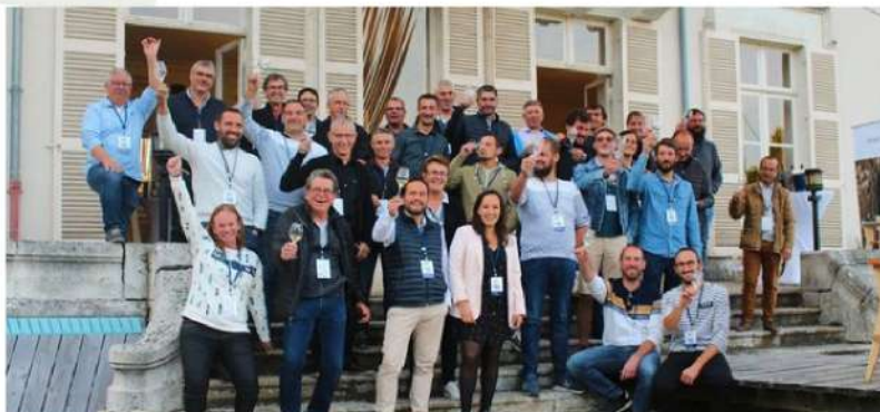
EXPÉRIENCE NOUVEL ANCRAGE